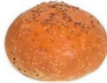
Булочка "С семенами льна"