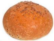
Булочка "С семенами льна"