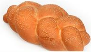
Плетёнка "С кунжутом"