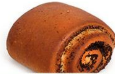
Булочка "С маком"