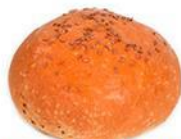
Булочка "С семенами льна"