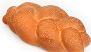
Плетёнка "С кунжутом"