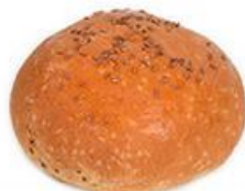
Булочка "С семенами льна"